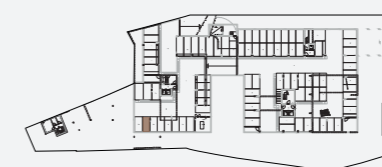
ESTACIONAMENTO | PISO -1